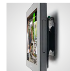
Apto para montaje de sobremesa y en la pared (VESA)

Infórmese ahora en su distribuidor Orderman o en oficinaiberica@orderman.com .