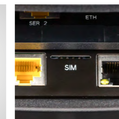
Conexión directa a la nueva Antena Orderman sin fuente de alimentación (PoE) (opcional)