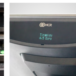
Display de clientes 2x20 elegantemente integrado (opcional)