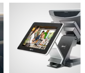
Visores para clientes en diferentes versiones (opcional)